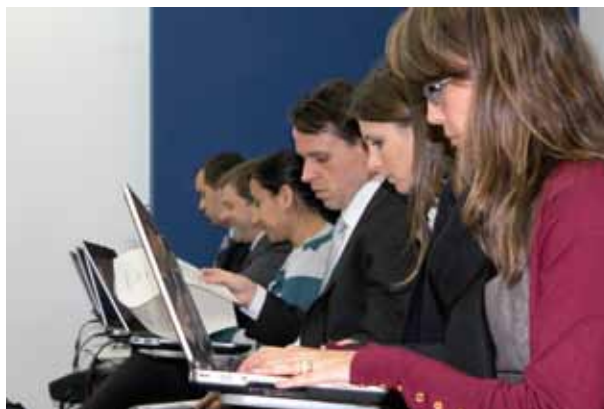
Os jovens promotores circulam pelas diferentes áreas

O II Módulo do Curso de Adaptação foi realizado de 1º a 16 de agosto, apresentando aos novos membros as procuradorias de justiça do MP, o setor de competência originária, os secretários executivos das procuradorias de justiça criminal e as diversas promotorias de justiça do Ministério Público paulista, com treinamento específico em habeas corpus, mandados de segurança criminais, cível e na área de interesses difusos e coletivos, além dos recursos especiais e extraordinários.