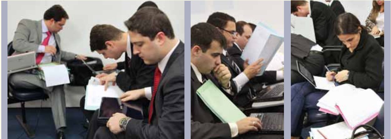
Novos membros participaram de monitoria e despacharam processos

de também seja o dono do jornal local, e que a sua família esteja nos cargos de comando da Câmara Municipal, do Fórum, da Escola, do comércio e dos postos de gasolina. É preciso traquejo político e, ao mesmo tempo, agir de forma técnica, com os rigores da lei.