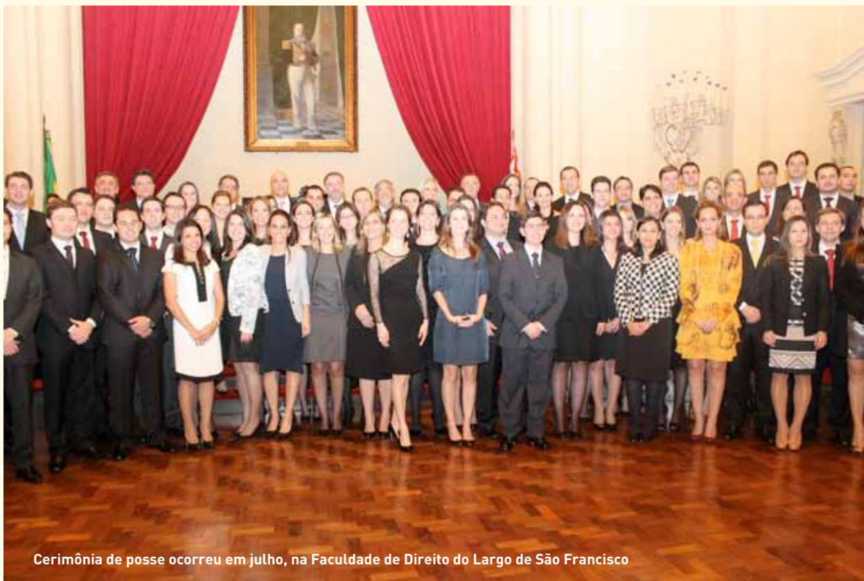
Cerimônia de posse ocorreu em julho, na Faculdade de Direito do Largo de São Francisco

Com a mesma habilidade em manter-se próximo a todos também deve preocupar-se com o distanciamento saudável para que tenha boas relações com as demais autoridades públicas do município, sem perder a isenção necessária para, por vezes, denunciá-las. E no interior, as fronteiras do poder são muito tênues. Não é raro que o Prefeito da cida-