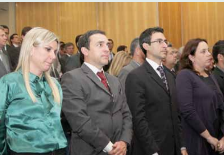
Promotores especialistas no combate à corrupção e lavagem de dinheiro