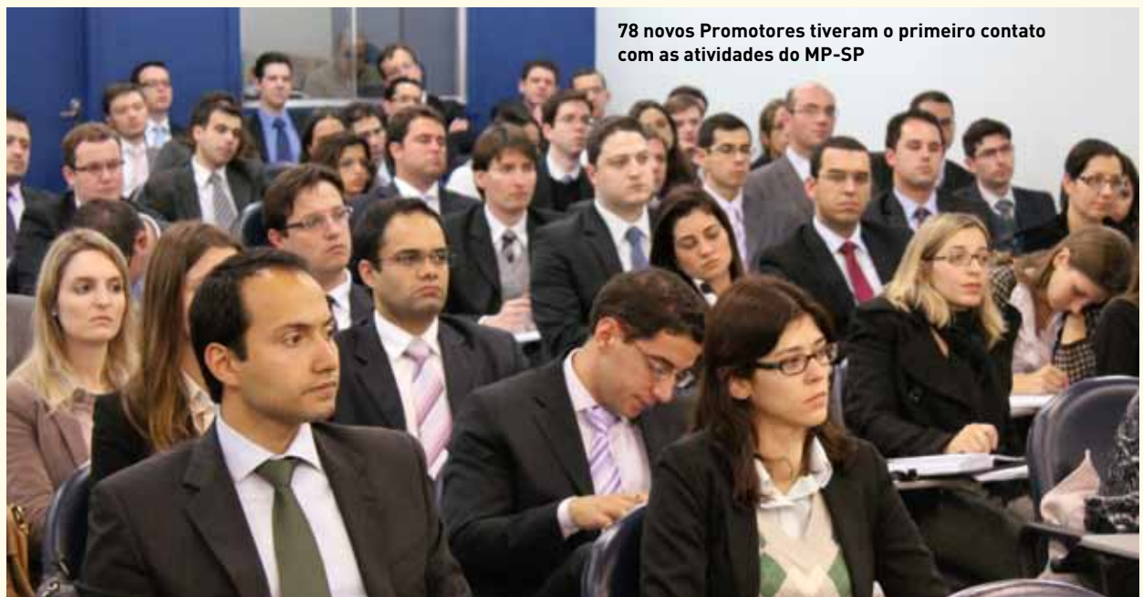
78 novos Promotores tiveram o primeiro contato com as atividades do MP-SP

“Estaremos sempre na retaguarda. Prontos para auxiliar os novos promotores no que for preciso. Podem contar conosco”, afirma a diretoria da Escola Superior do Ministério Público. ■