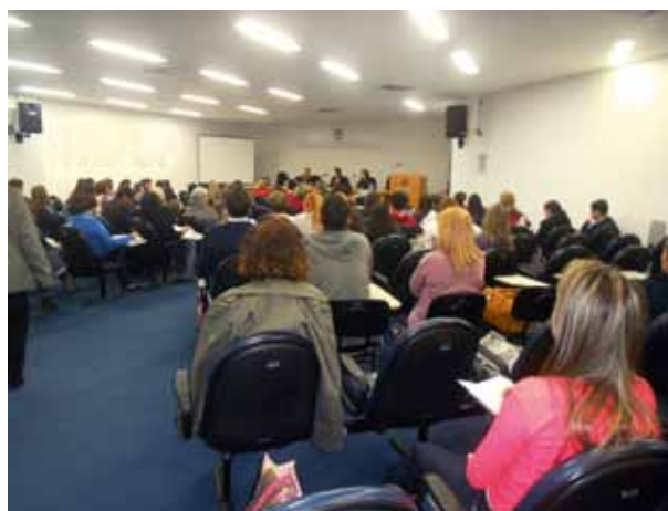
Profissionais das diversas áreas prestigiam o evento