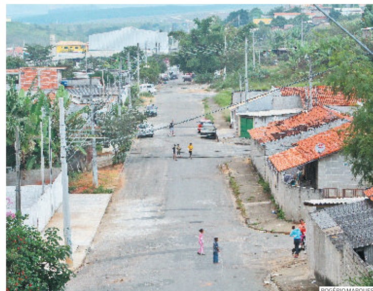
Rua Nelson Ferrari, em Taubaté, onde rapaz de 28 anos foi atropelado propositalmente quatro vezes seguidas anteontem

"Pelo relato da testemunha no boletim de ocorrência, a intenção dos autores era matar, sem usar um revólver, mas utilizando um carro e fazendo-o passar várias vezes sobre a vítima", afirmou Totti. ●