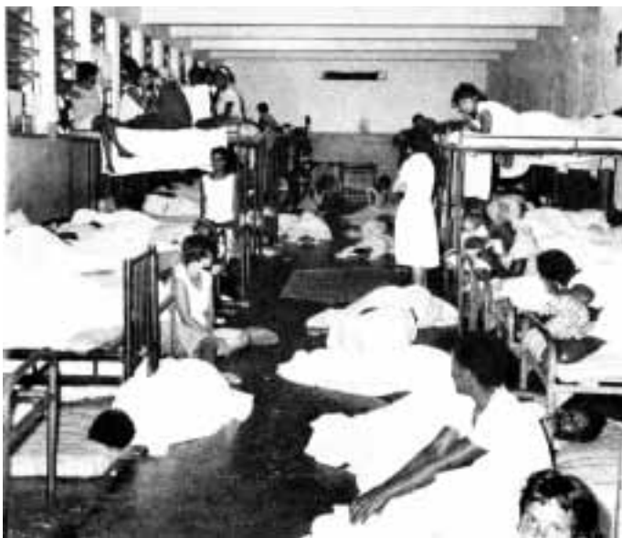
SAM - Dormitório - Pavilhão Anchieta - Quintino, RJ, 1964 (data provável) Revista Funabem Espaço - vol I, nº 42 - dez/1983, p.17.

O SAM foi instalado pelo governo ditatorial de Getúlio Vargas, em 1941. O novo Serviço herdou o modelo e a estrutura de atendimento do Juízo do Distrito Federal e pouco a alterou nos primeiros anos de sua implantação. A meta do alcance nacional revelou-se um fiasco, conforme testemunho do diretor nos anos 1955-1956. Os escritórios instalados tornaram-se cabides de emprego para “afilhados