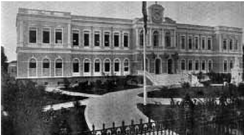
Instituto Gentil Bintencourt (Belém, Pará)