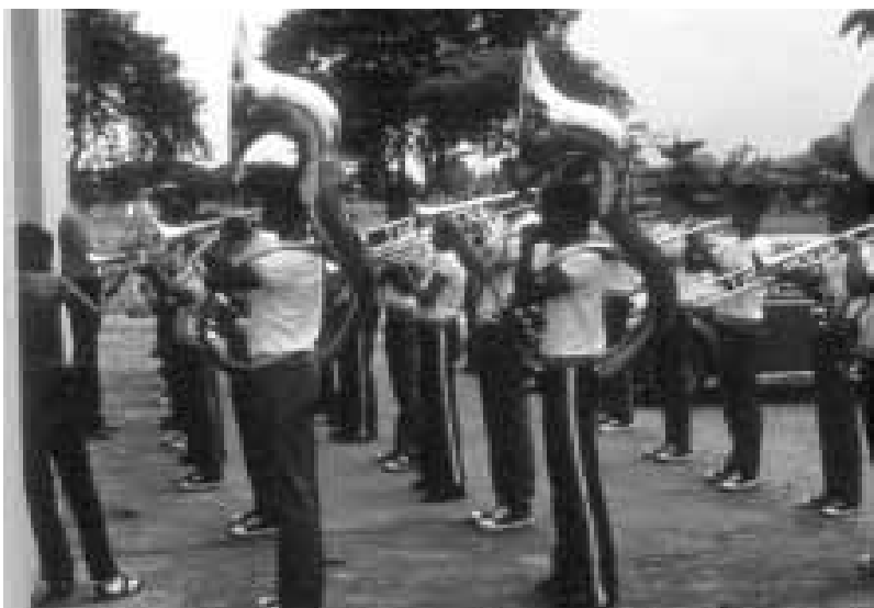
A formação de bandas de música evidenciava o sucesso educacional das instituições masculinas.