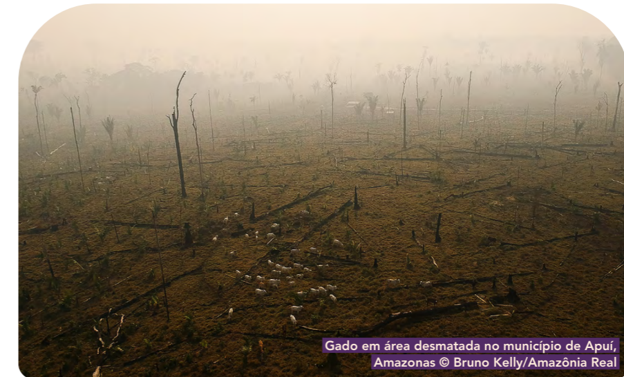
Gado em área desmatada no município de Apuí, Amazonas

O documento está estruturado em cinco seções. Após a introdução, a seção 2 apresenta casos proeminentes que exemplificam o fracasso do Brasil em lidar com o desmatamento e suas ligações com as mudanças climáticas. A Seção 3 analisa as lacunas nas leis, políticas e práticas brasileiras que levam ao desmatamento e as preocupações climáticas destacadas nesses casos. A Seção 4 discute os comitês, iniciativas e instrumentos da OCDE pertinentes para a questão da proteção ambiental. Por fim, a seção 5 conclui com a identificação tanto das reformas que o Brasil deve adotar para fechar as lacunas analisadas quanto das recomendações para medidas que a OCDE e seus Estados membros devem tomar para garantir termos rigorosos para a adesão do Brasil e um processo de revisão transparente e participativo.