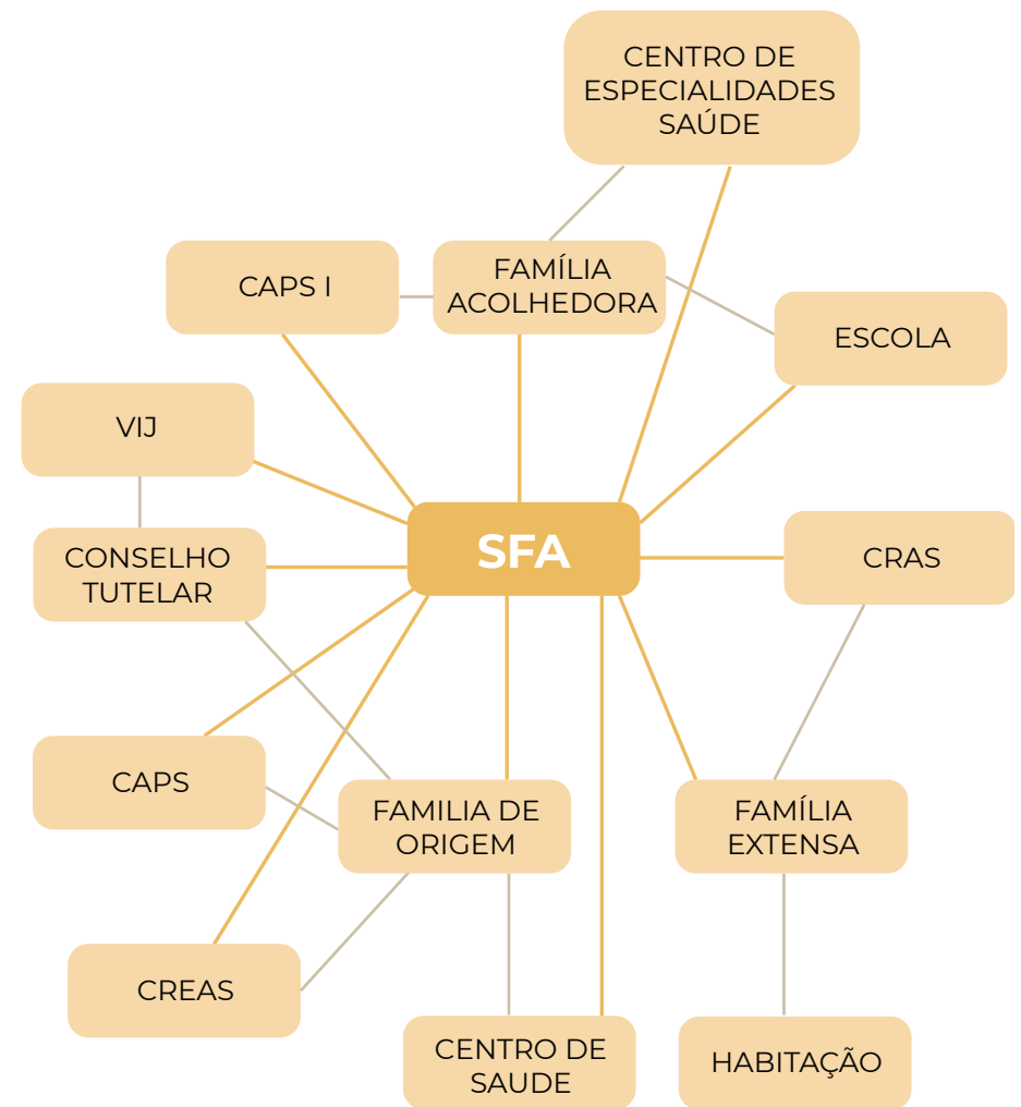
O Servio de Acolhimento em Famlia Acolhedora como ‘ancoradouro da rede’.

 comum que o SFA exera esse papel, uma vez que  quem est responsvel pela criana e/ou adolescente e funciona como referncia para os rgos da Justia, cumprindo prazos pr-estabelecidos em Lei. O Servio de Acolhimento em Famlia Acolhedora tambm aciona diversas polticas pblicas (de assistncia social, da sade, da educao, da habitao, da cultura, do esporte, do lazer, do trabalho e da renda) e rgos como o Conselho Tutelar, a Defensoria Pblica e o Ministrio Pblico, alm de agilizar o envio de relatrios que demonstram o trabalho realizado, ou encaminha-os de forma conjunta.