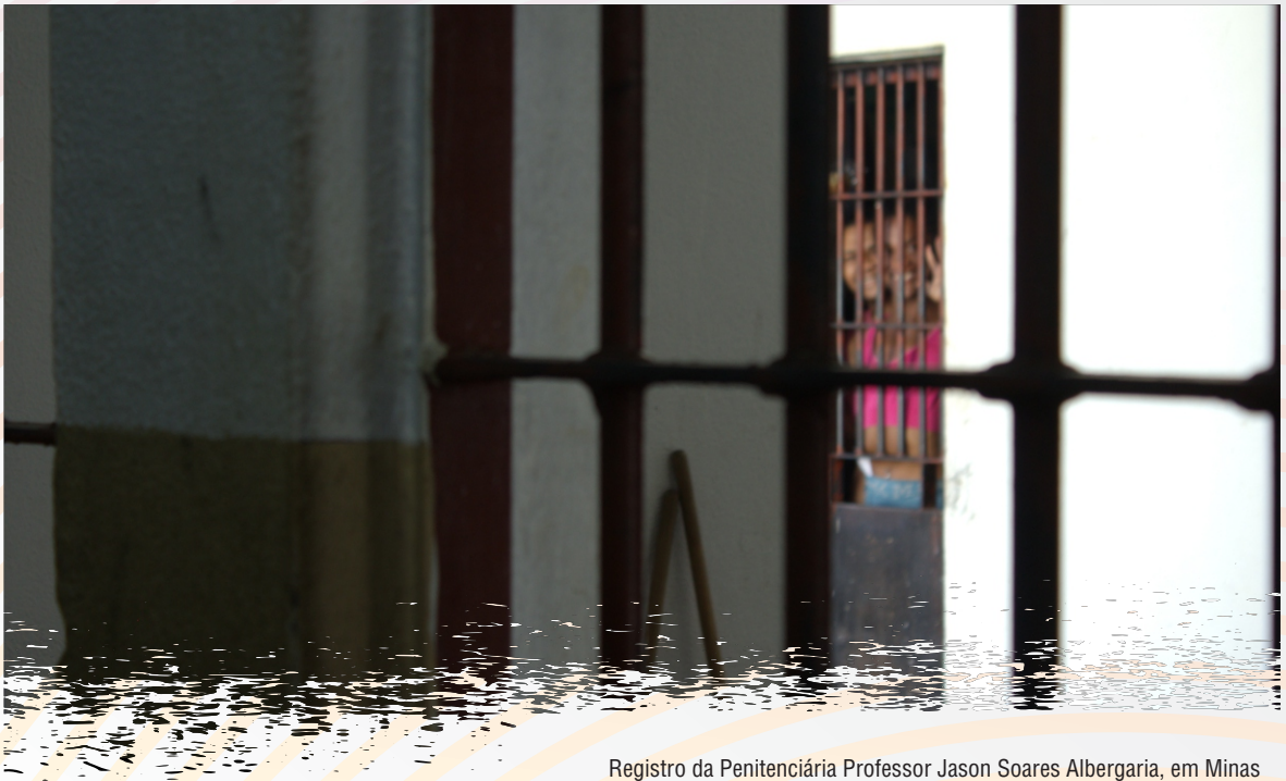
Registro da Penitenciária Professor Jason Soares Albergaria, em Minas Gerais, por ocasião da execução do projeto Passagens.