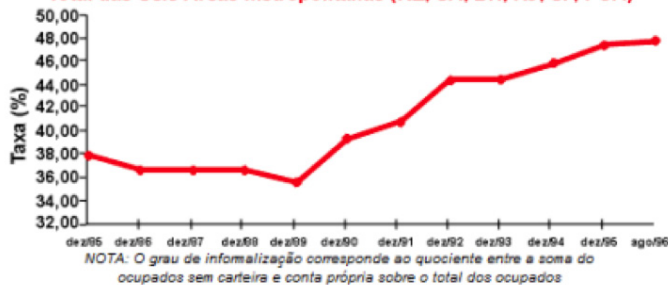
EVOLUÇÃO DO GRAU DE INFORMALIZAÇÃO DO PESSOAL OCUPADO Total das Seis Áreas Metropolitanas (RE, SA, BH, RJ, SP, POA)

As condições adversas da economia do País presentes no início da década, aliadas a uma legislação trabalhista rígida, levaram os trabalhadores a aceitar empregos de baixa qualidade, ou a buscar a sua subsistência como autônomos ou assalariados sem carteira.” (grifo nosso)