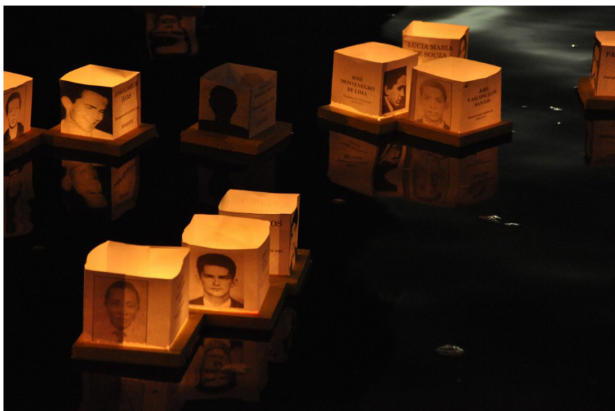
Figura 2 – Intervenção urbana no Mausoléu Castelo Branco

Um sítio de Consciência é um lugar de memória - um local histórico, museu de base local ou memorial - que confronta tanto a história do que aconteceu no local quanto suas implicações contemporâneas. Sítios de Consciência destacam a coragem, a crueldade, ou a vida cotidiana através de programas de diálogo público que visam ativar a perspectiva dos sítios históricos, conectando-o com questões que enfrentamos hoje, e convidando os visitantes a refletir sobre o papel que eles podem desempenhar na resolução destas questões. (NAIDU, 2013: 7)