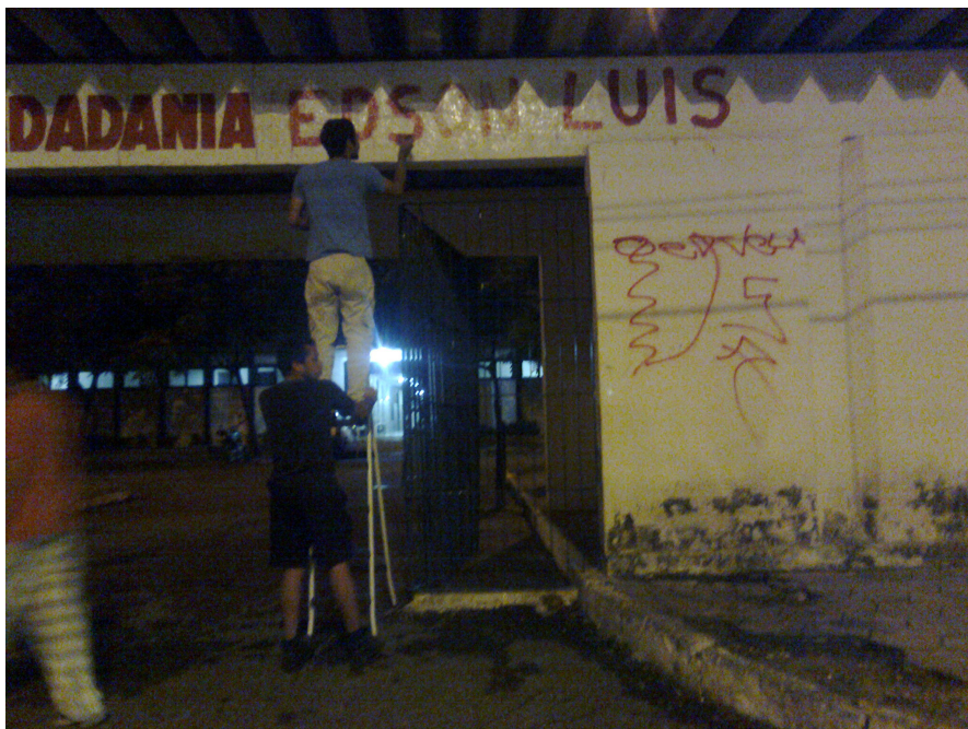
Figura 4 – Rebatismo do centro urbano de Pres. Médici para Edson Luís

Após aquela ação, aos poucos, a fachada do prédio foi perdendo sua identidade, numa consequência do que havia sido aquela intervenção e de sua repercussão na própria prefeitura. Como se pode visualizar na imagem abaixo (Figura 5), o local mudou, desde o nome original, passando pelo nome rebatizado, até ser finalmente demolido – os escombros possibilitam uma interessante analogia com uma passagem de um texto do filósofo Walter Benjamin: