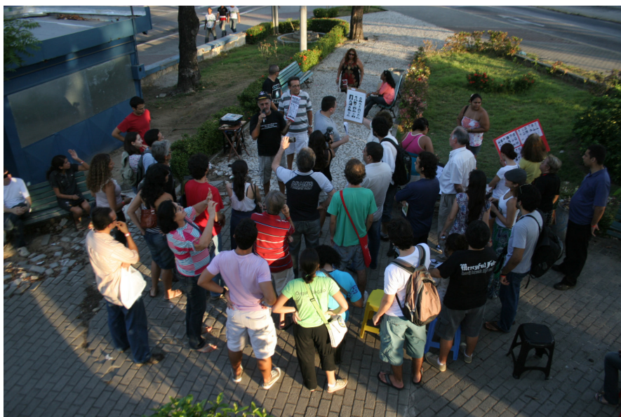
Figura 3 – Feira da Memória em frente a um antigo centro de prisão e tortura da Ditadura

cambo cultural com troca de livros, obras artísticas, poesias etc. Além da ideia desse intercâmbio, uma das propostas era de se apropriar daquela praça para reverter o abandono da mesma e, ainda, criar um espaço de troca de memórias coletivas, não só relacionadas à ditadura militar, como também ao bairro e à cidade.