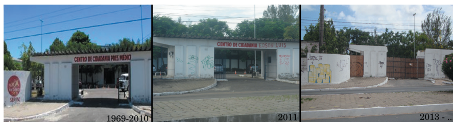
Figura 5 – Processo de mudança do nome do local com o passar dos anos

O rebatismo do Centro Social faz parte de um processo de criação de novas memórias, novos espaços e da estrutura de uma cidade com um corpo social próprio, antes voltada para homenagem à repressão e, agora, com abertura para novas possibilidades. Esse exemplo é um dos mais notórios fatores que demonstram como uma intervenção urbana pode, de fato, abalar não só a estrutura física como também institucional (e, principalmente, simbólica) da cidade.